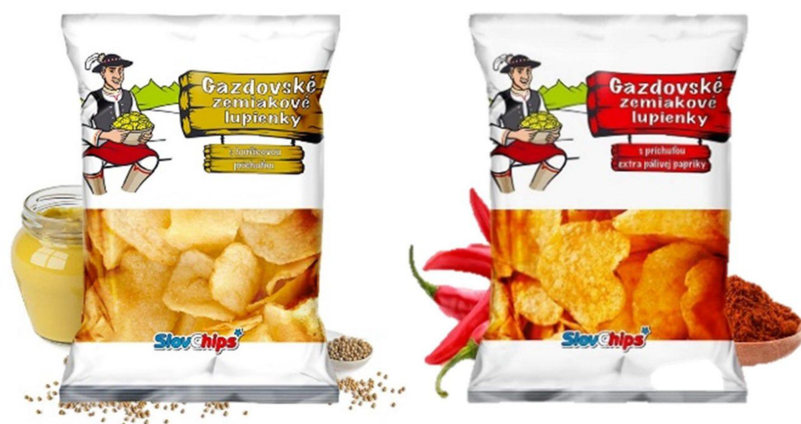
- Tomáš Szapola, manažér predaja pre východné Slovensko